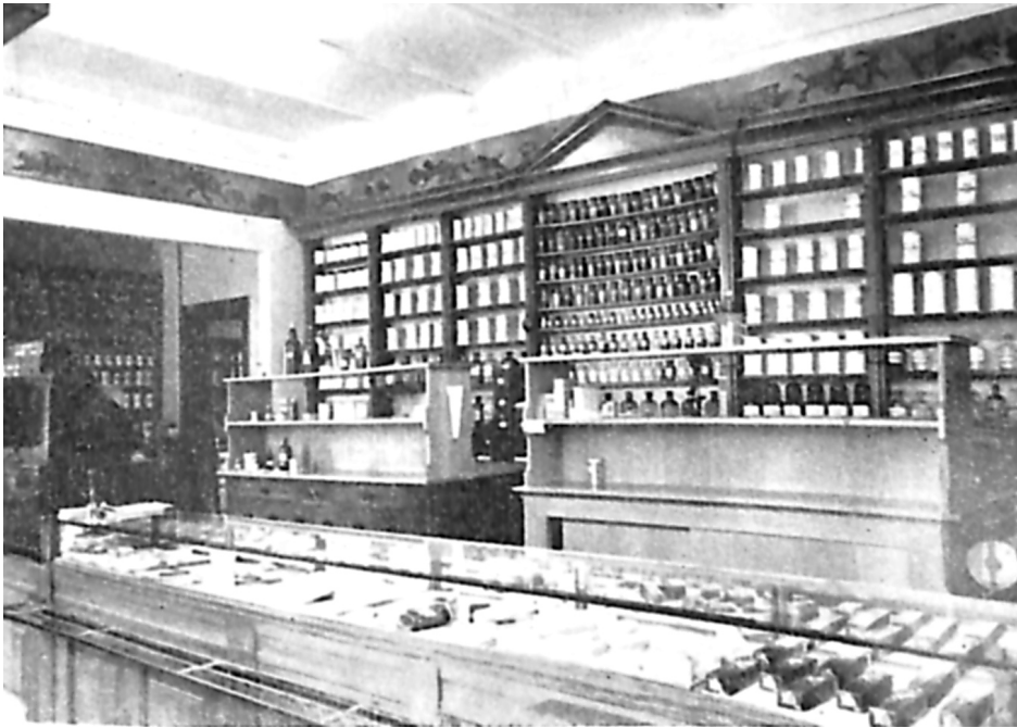
Grenaa Apoteks officin i 1944 forinden ombygningen.