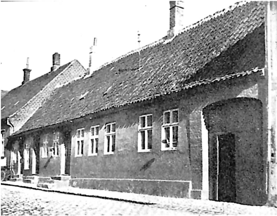
Apoteksbygningen i Søndergade (nuv. nr. 6) ca. 1767-1803.