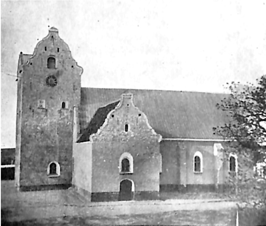
Grenå Kirke, således som den så ud efter restaureringen i 1760.