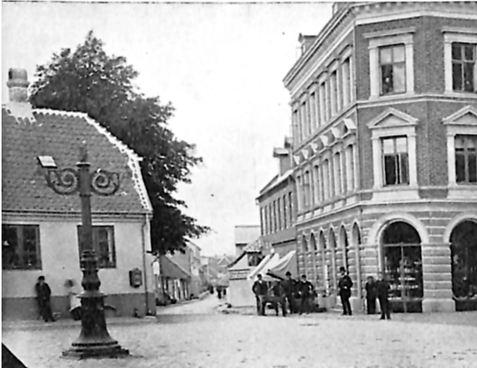
Det gamle Apotek på Torvet ca. 1890. Hjørnet mod Lillegade.