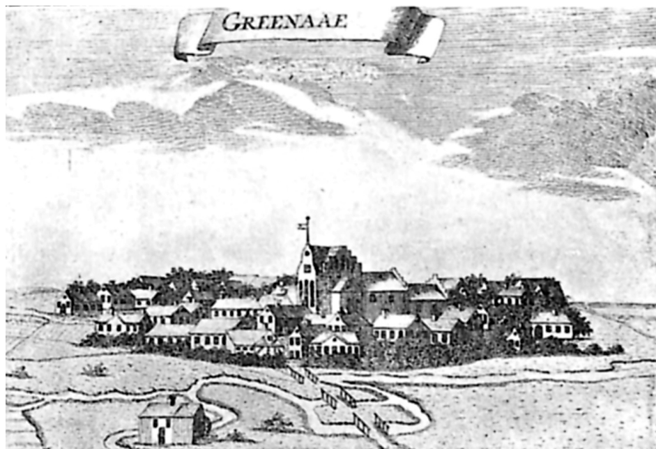
Stik efter Pontoppidans Danske Atlas, Bind 4. Således afbillede man i 1768 Grenå by og kirke.

befolkningen selv enten på markederne eller hjemme af omrejsende kvaksalvere.