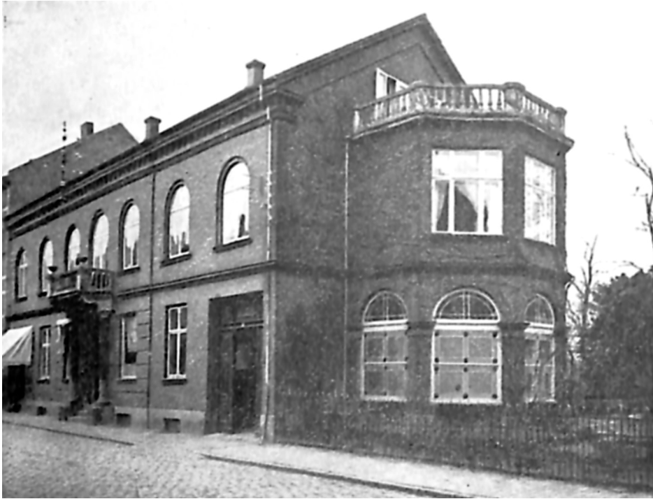
Grenå Apotek på Østergade i Apoteker Thomsens Tid.

af »Sønderjysk Forening«. Han var en stille mand, der ikke deltog stærkt i offentligt liv og ikke havde hverv ud over nævnte. Der er ingen tvivl om, at det, som optog ham stærkest ud over hans erhverv og hans hjem, var den sønderjydske sag.