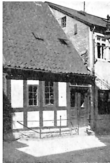
Den ældste, endnu eksisterende rest af det gamle apotek på Torvet. Her var Apotekerens laboratorium.