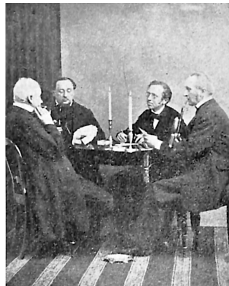
Et l'hombreparti ca. 1865.