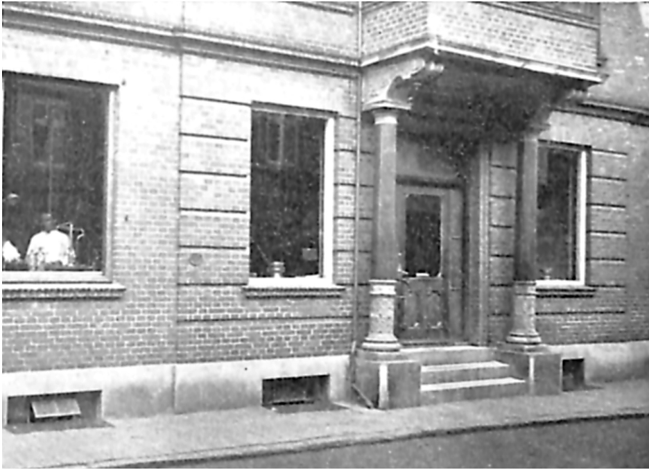
Grenaa Apoteks facade set fra vest.