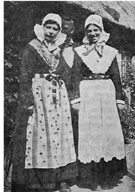
To gamle, velbevarede kvindedragter fra Anholt - til venstre en »daglig« kjole, til højre en brudedragt. (P. G. K. Bentzon foto).

Fruentimmerne (Dagten gjør ingen Forskjel imellem Koner og Piger) vare iførte et mørkt Hvergarms Skjørt med grønne og røde Striber; dertil en kun med store Knappenåle befæstet Trøie af sirts, ligeledes mørk i Bunden, med Blomster af levende Farver. Et rødt blommet Tørklæde,