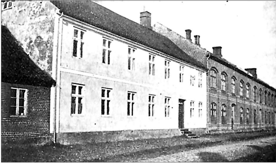
Grenå ældste skoler på Vestergade, opført henholdsvis 1848, 1867 og 1887.

nu Chr. Christensen bor, en rest af Vesterports Bod, men det er ret usikkert.