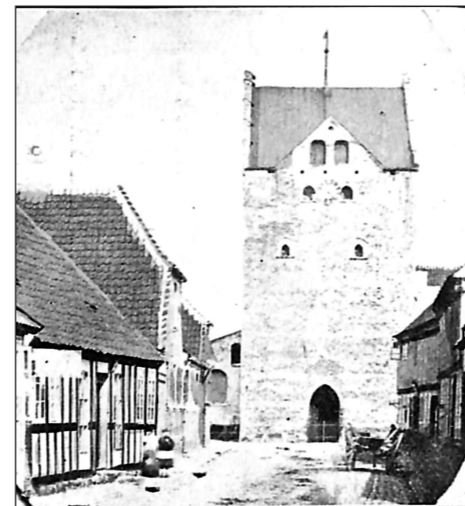
Storegade op imod kirken omkring 1800.