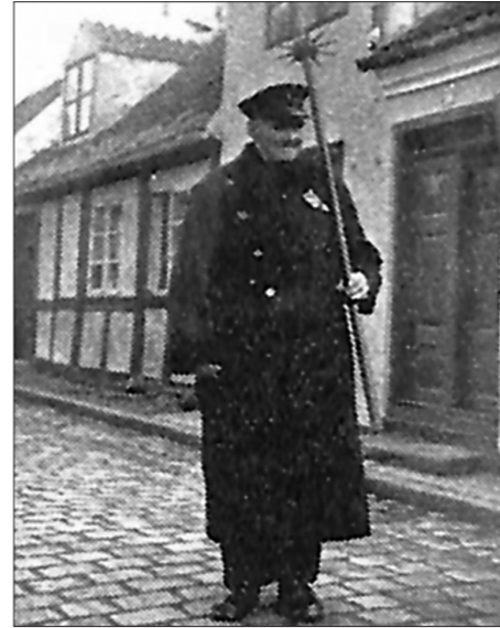
Byens gamle vægter med morgenstjernen.

Grenå ældste kirke lå et lille stykke oppe ad Bavnhøjbakken, lidt nord for det gamle anlæg. Den har været opført i Valdemar Sejrs tid og har