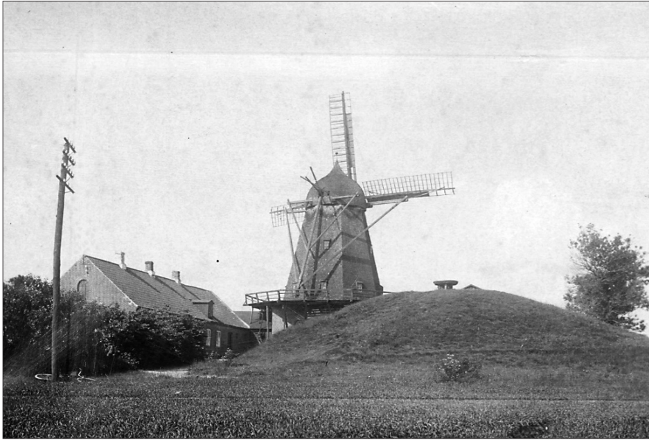
Bavnhøj Mølle med højen set fra øst.

Og endelig flyttedes det omkring 1900 ud på Østergade i den nyopførte, røde bygning, som vi alle kender.