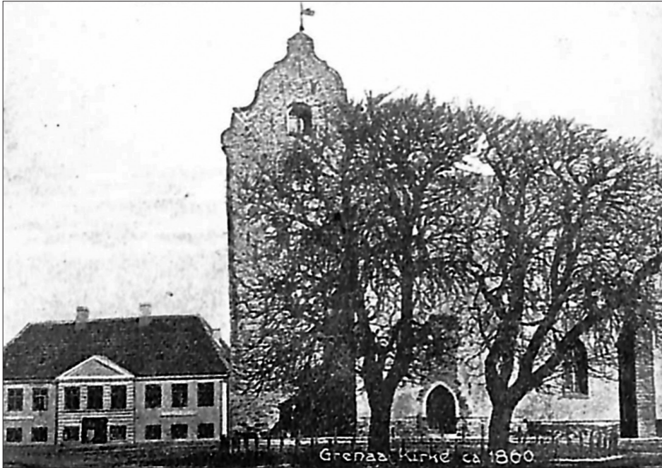
Grenå Kirke før ombygningen.

at holde et får. Alle disse kreaturer gik løse ude i Kæret, og til at passe dem holdtes en byhyrde, der fik en lille årlig afgift af hver koholder.