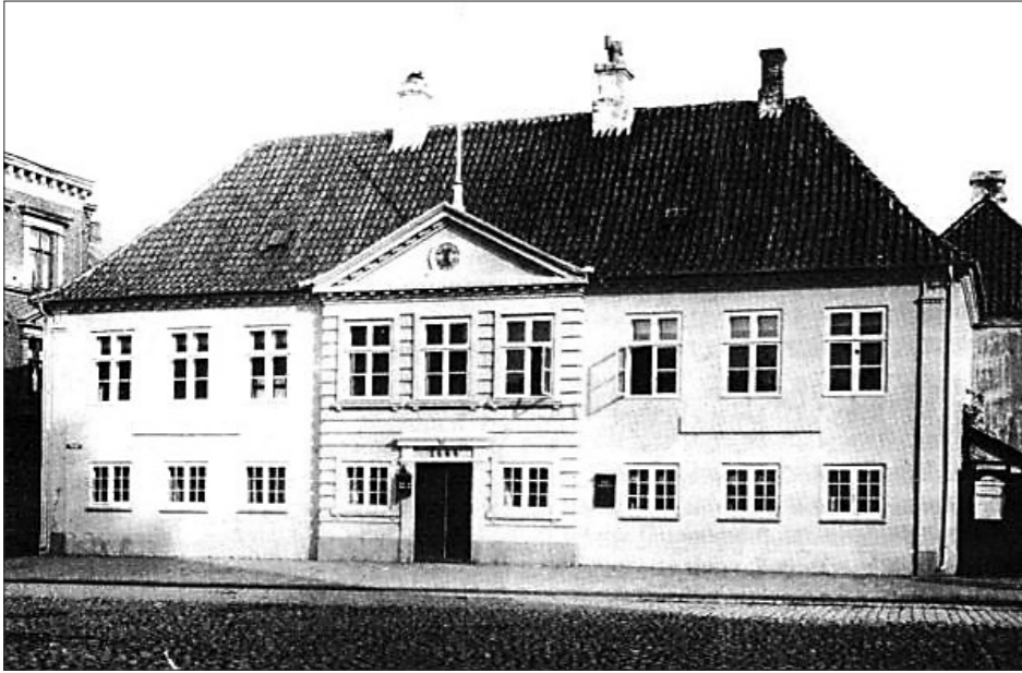
Grenå Rådhus. opført 1805.

I de mange år, som er gået siden den tid, er kirkegården selvfølgelig bleven udvidet mange gange, og et ligkapel er bygget.