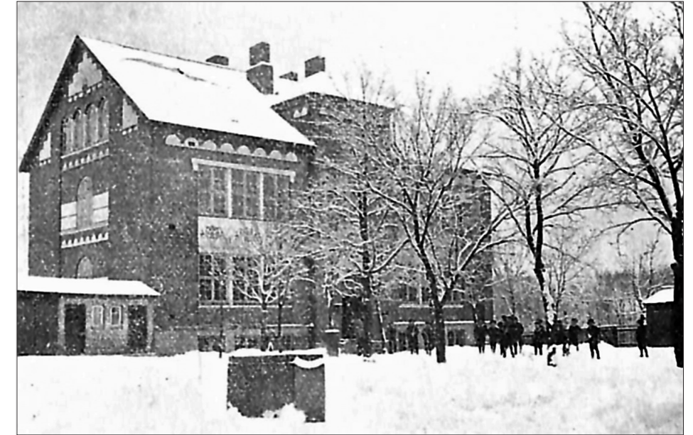
Grenå mellem- og realskole opført 1912.