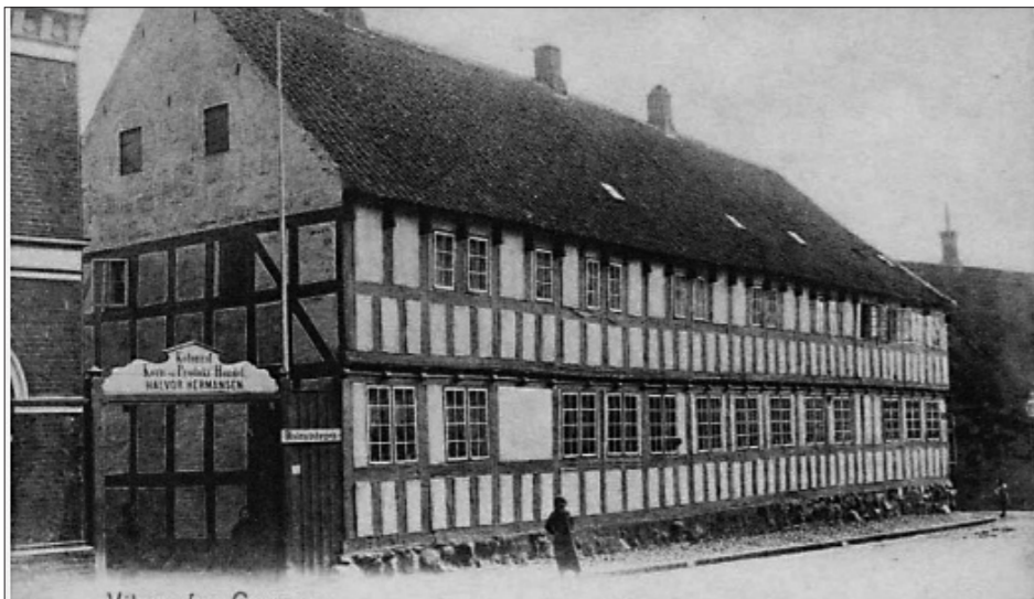
Købmand Skovs Gård på Søndergade. Byens smukkeste og ældste bindingsværksbygning.

gange afbrændte store dele af byen. Under svenskekrigen afbrændte således i 1626 (eller 27) hele den østlige del, og i 1750 og 51 gik det på samme måde med hele den midterste del af Storegade og Lillegade. Dengang var det dog ikke krigen, der var skyld i branden.