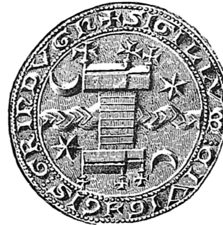
Byens Segl fra 14. århundrede.