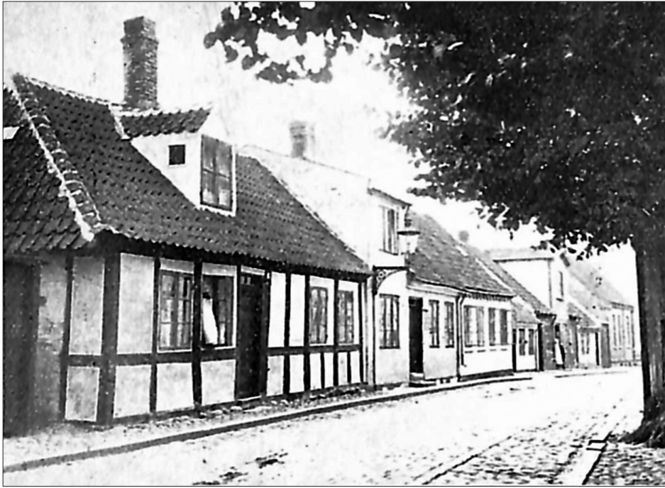
Gamle huse i Kannikegade.