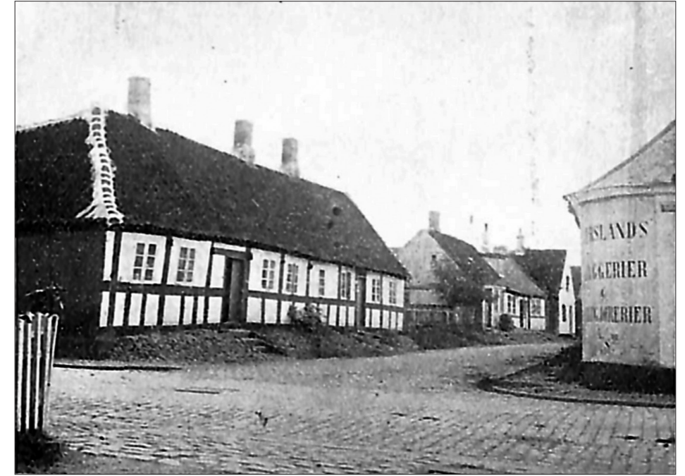
Gamle huse i Nederstræde.

Men sand, som af strømmen førtes langs strandbredden, og dynd