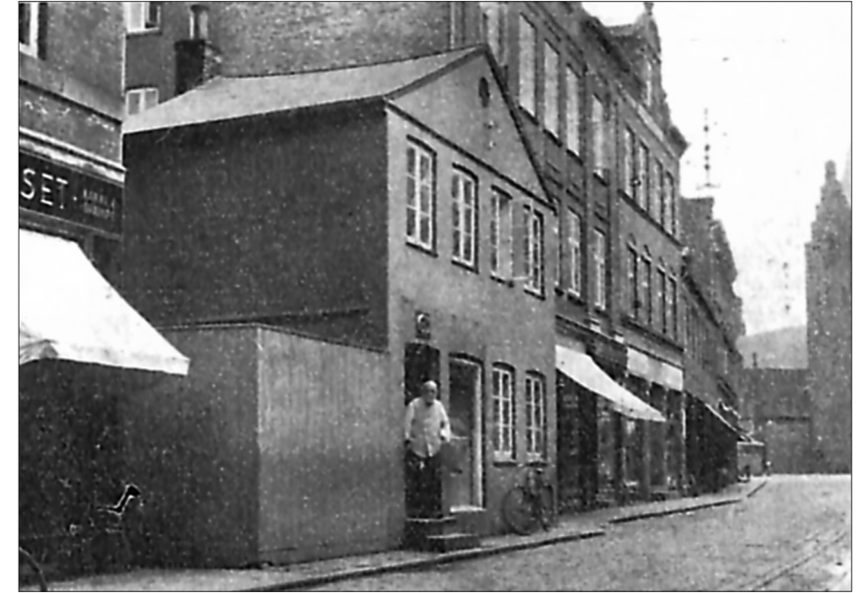
Lillegade med Hartmanns Butik, kort før Nedrivningen Sommer 1931.

Atter er et af vore gamle Grenaa-huse faldet, og et nyt har rejst sig paa Grunden. Bager Hartmanns morsomme lille Gavlhus, som ragede saa langt ud paa Fortovet, at det næsten naaede Rendestenen, og som var kendt af alle i Byen og Omegnen, er ikke mere.