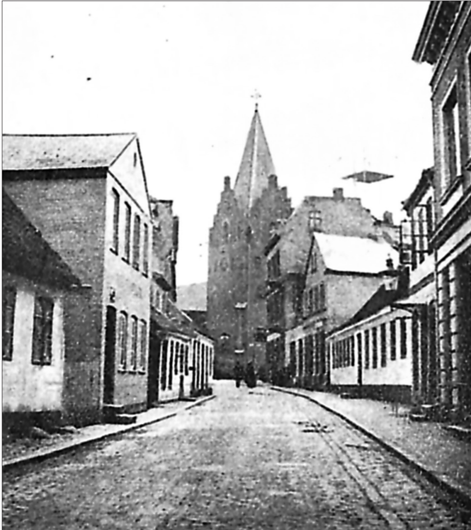
Lillegade ca. 1900.