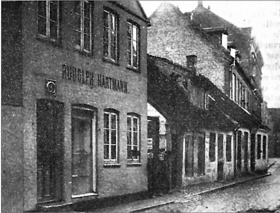
Lillegade ca. 1905.