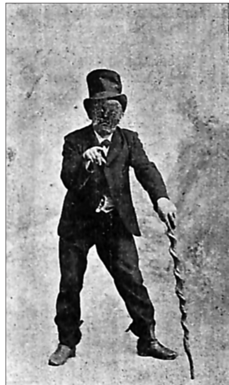
Zebitz som »Syl«.

Og i Hullet putted' Politiet da Blomberg paa Minuttet, men han »nej!« dog sa';