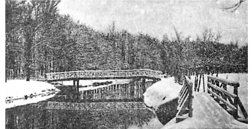
Den hvide bro over åen, lige over for Pavillonen, som blev bygget i anledning af ungskuet.